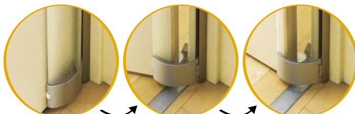
フラップが扉を やさしく包み込み